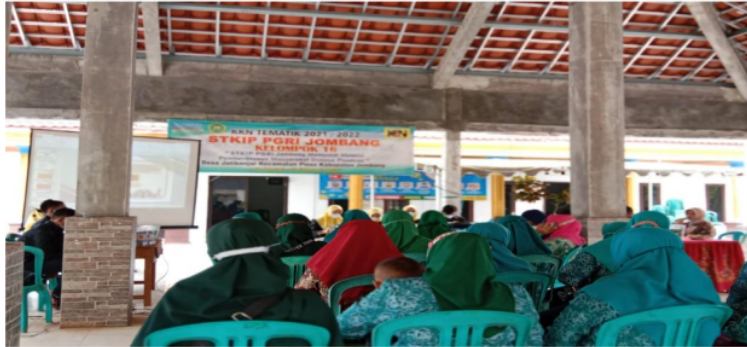
Gambar 2. Penyampaian materi tentang olahan kripik labu