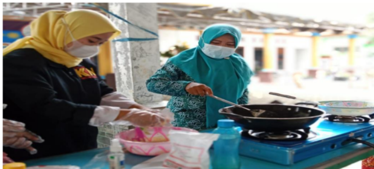
Gambar 3. Praktik membuat olahan kripik labu