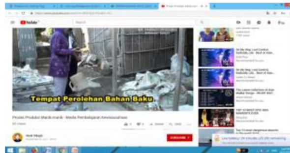
Gambar: film pemutaran film dokumen proses produksi