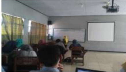
Gambar: Dosen mengajar tatap muka langsung