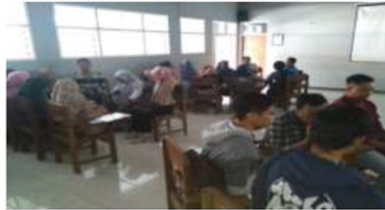
Gambar: mahasiswa berdiskusi